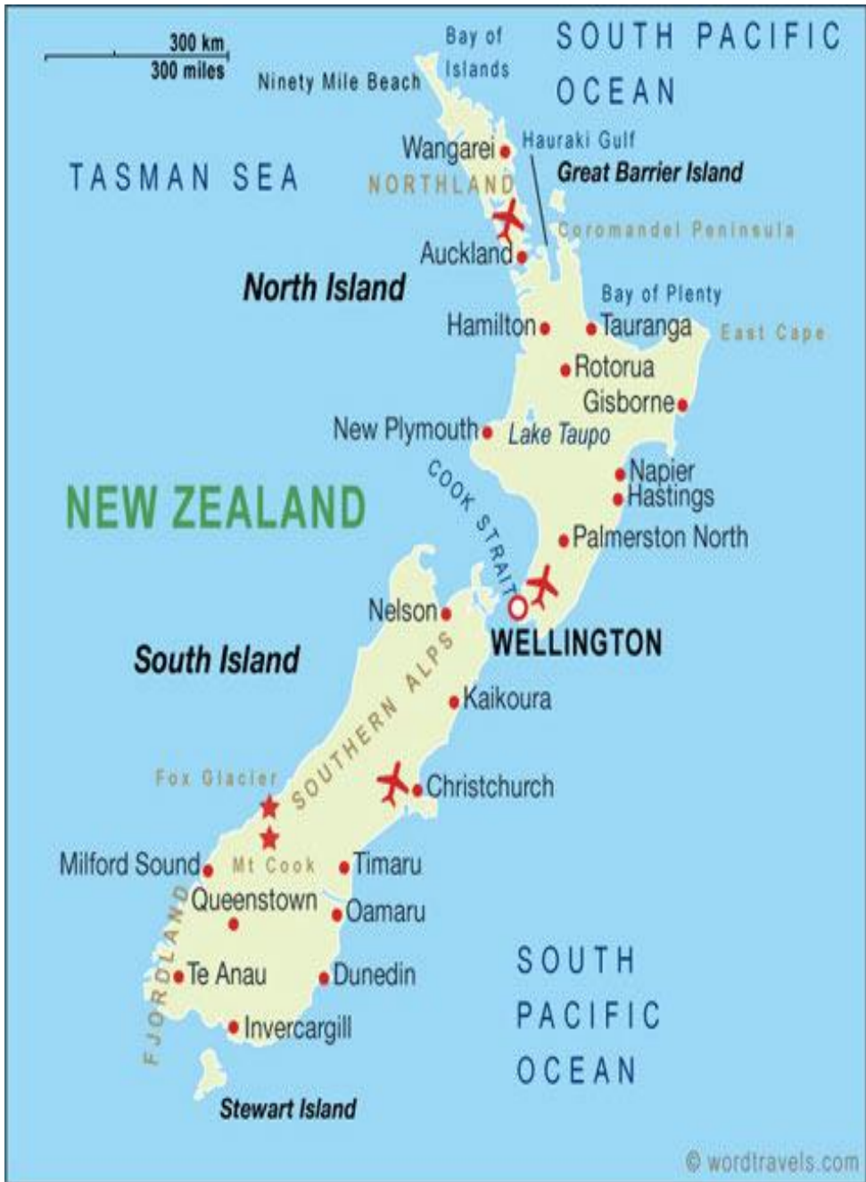
NEW ZEALAND MAP OF NORTH AND SOUTH ISLANDS