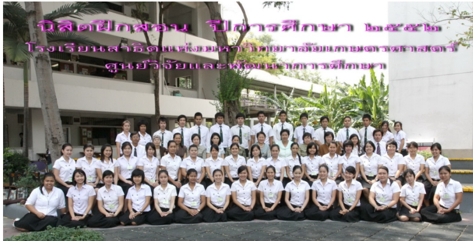
นิสิตฝึกสอนปีการศึกษา ๒๕๕๒ ถ่ายภาพพร้อมกับอาจารย์ใหญ่ ในกิจกรรมปัจฉิมนิเทศ