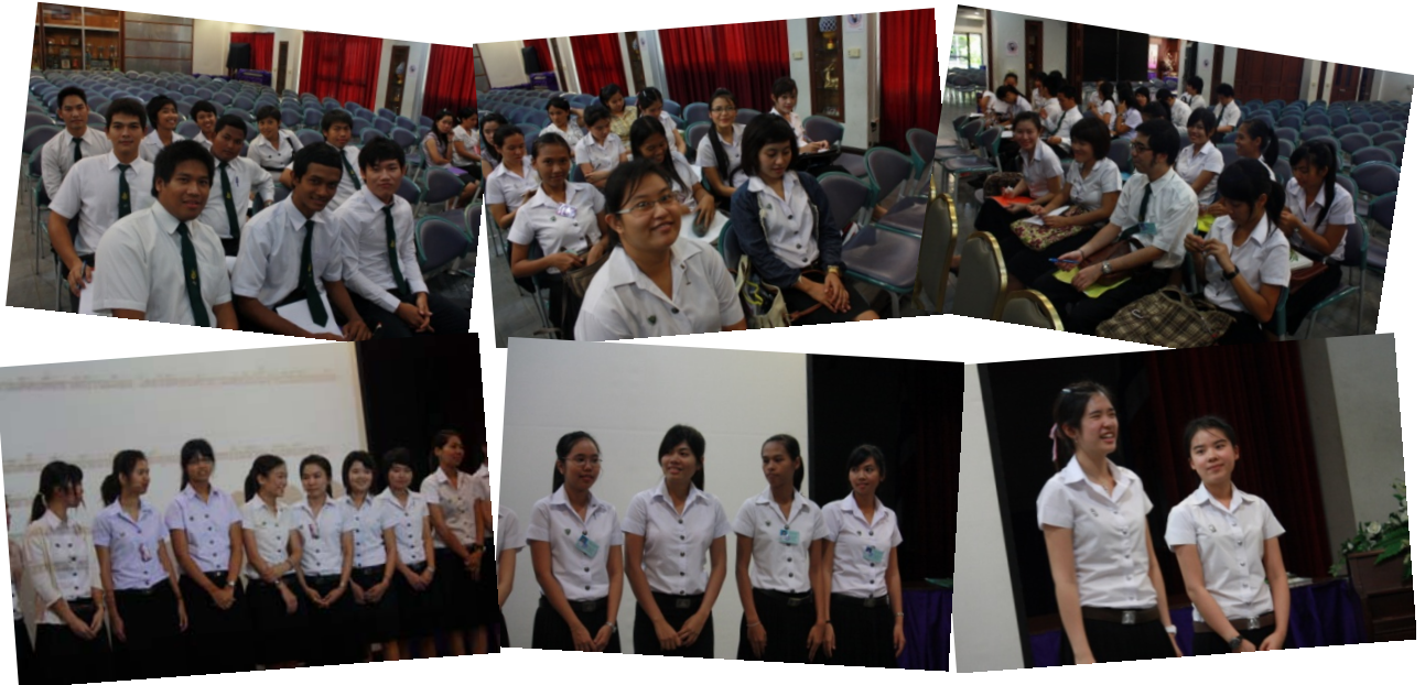
นิสิตฝึกสอนปีการศึกษา ๒๕๕๓ ในกิจกรรมประชุมนิเทศและแนะนำนิสิตฝึกสอน ในการประชุมรวมอาจารย์ปีการศึกษา ๒๕๕๓